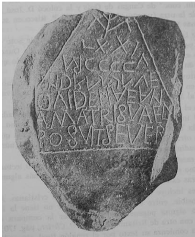
Lápida de Dovidena. Fuente: Diego Santos, Francisco, Epigrafía Romana de Asturias , Oviedo, IDEA, 1985, pág. 145

En Soto de Cangas, también de la parroquia de Santa Eulalia de Abamia, han sido recogidas tres lápidas, dos de las cuales han sido clasificadas como cristianas. La primera, la estela de Noreno, se encontró en la ería de Susierra, y la compró Cortés Llanos al campesino que la había hallado. Pasó a poder de Sebastián de Soto Cortés, quien la compró a su primo Antonio Cortés hijo del Llanos. La lápida paso de Labra, donde se hallaba al Museo Arqueológico de Oviedo. La lectura de su contenido y su decoración tienen, sin duda, datos no paganos. La segunda es la Estela de Magnentia, aparecida en la ería de Soto en 1888. estando un vecino arando. Pasó a poder de Sebastián de Soto y con su colección pasó al Museo de Oviedo. Faltan en la inscripción las fórmulas paganas, y por su contenido hace pensar en una auténtica lapida cristiana. La tercera es la estela de Elanus, aparecida en el año 1946 y publicada en el año 1967. Pertenece a un particular, vecino del mismo pueblo. Está adornada con un árbol a cada lado de la fórmula inicial a los dioses manes y la inscripción está completamente distribuida en nueve renglones. No hay puntuación aparente, ni enlace de letras.