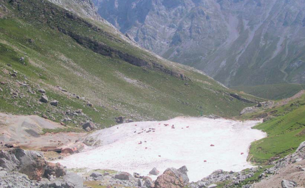
Los Urrieles: entorno de la Mina Las Mánforas (Áliva), donde destacan las instalaciones mineras (a la izquierda) y la impactante acumulación de estériles blanquecinos.

ocasiones, salvan desniveles de 1.700 m.