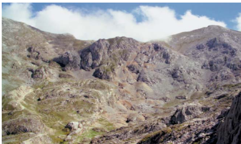
Ándara: explotaciones mineras de La Providencia en la Cuesta de La Escalera (vertiente noroeste del collado San Carlos).

Para poder dar salida al material fue preciso construir caminos que enlazasen Áliva con Espinama